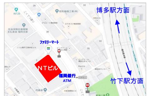
美野島1丁目バス停