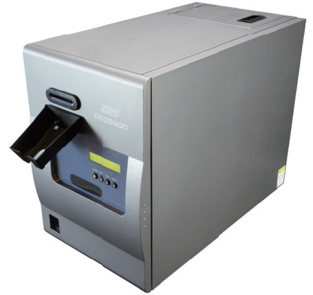
スタッカー装着時