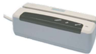
磁気カードリーダー