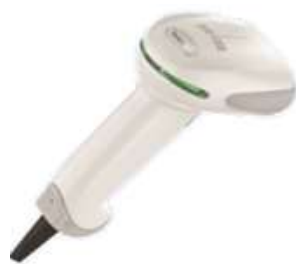
バーコードリーダー